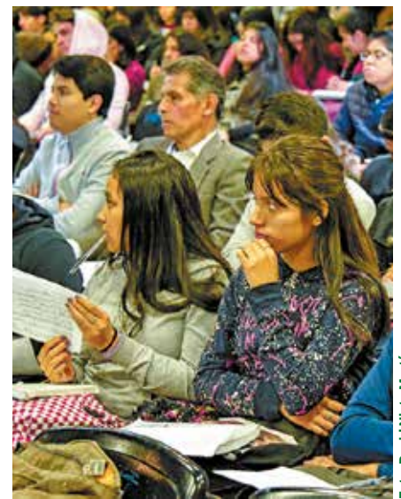
Los estudiantes en las ponencias.