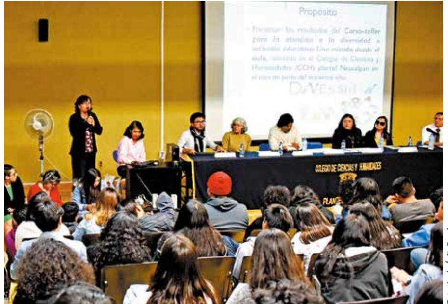
Los auditorios de los planteles fueron los espacios para el análisis.

“Institucionalmente se han hecho campañas de valores universitarios