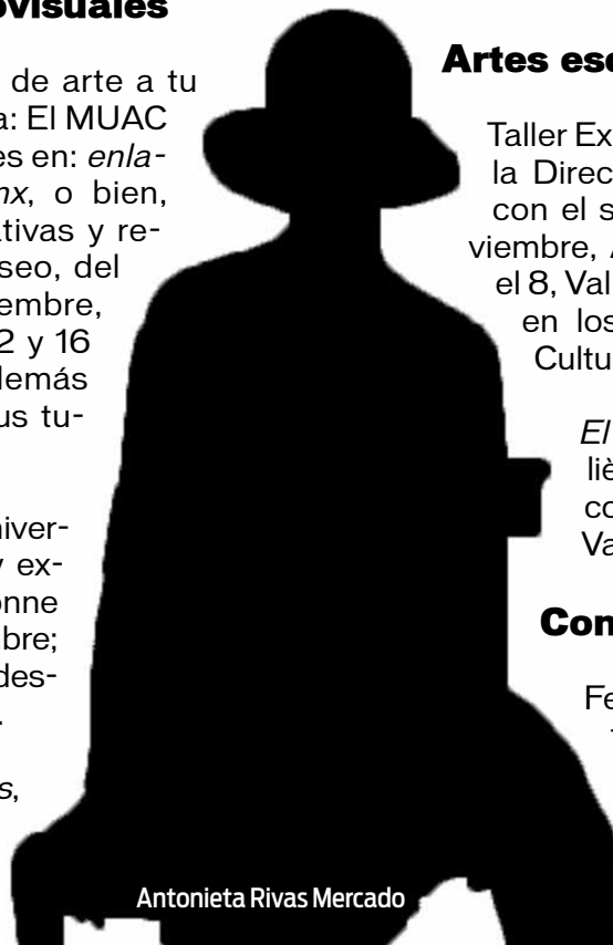
Antonieta Rivas Mercado

Festival Eco Goth: exposiciones, talleres, conferencias, performance , actividades musicales. Plantel Azcapotzalco, 6 de noviembre. Informes en el Departamento de Difusión Cultural de ese plantel.