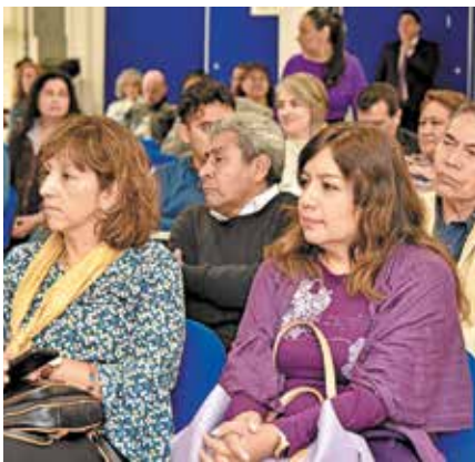
Los docentes, atentos al debate.

que es una figura que anima, apoya, guía, es compañero, pero hoy más que nunca requiere de una formación, que ya no es sólo disciplinaria, debe entrar a la interdisciplina que permite tomar todo aquello que le sirva para trabajar con los adolescentes de este nivel.