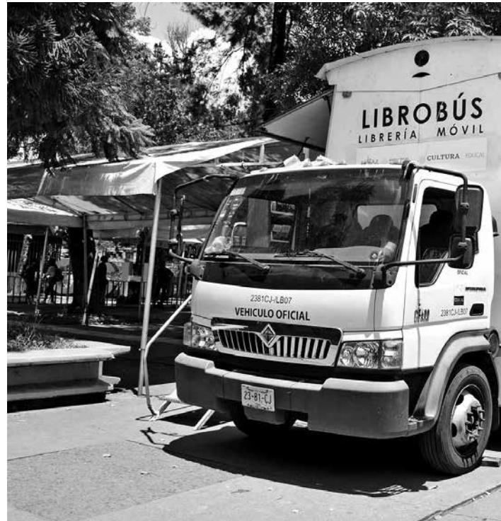
La Clementina luce guapa con su oferta editorial en las escuelas.

4,500 ejemplares han sido desplazados a través de la librería ambulante en sus visitas a las escuelas.