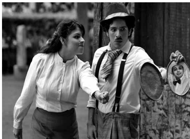
Escena de El cornudo imaginario , de Molière.

El cornudo imaginario , de Molière, por El carro de comedias. Plantel Naucalpan, 23 de septiembre, 13 horas.