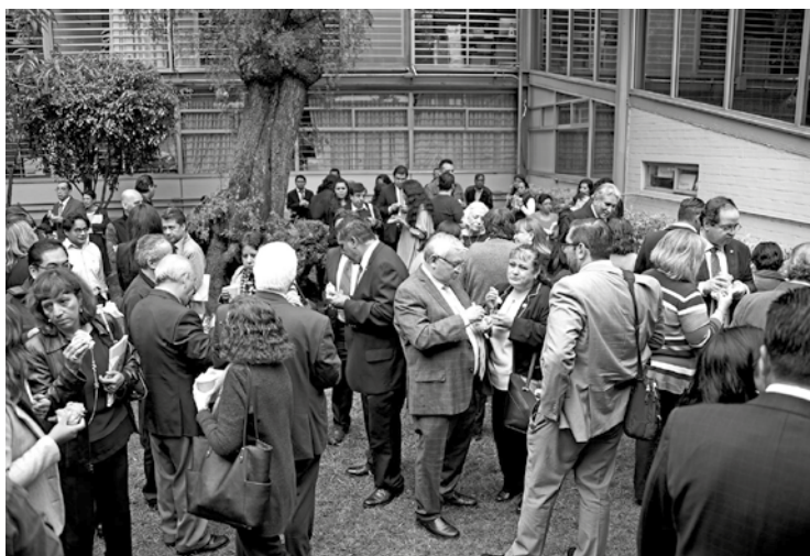
El convivio de funcionarios, directores y personal, tras el informe.

Se dará continuidad al aumento de la calidad de los aprendizajes, se ajustarán los Programas de Estudios, se revisará el Programa de Formación de Profesores, se buscará simplificar los procesos de evaluación de los profesores y se fomentará la identidad del Colegio, entre otros retos que mencionó el director general del CCH.