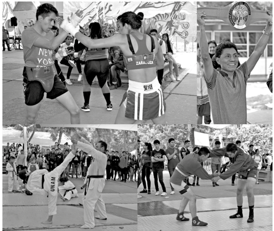
Demostración de box, taekwondo y lucha. Estuvo presente El Olímpico .

Expresó que sería un gran paso que el Colegio contara con un equipo de boxeo para competir en los eventos universitarios, nacionales e internacionales, y para aprovechar el potencial juvenil de los estudiantes del CCH.