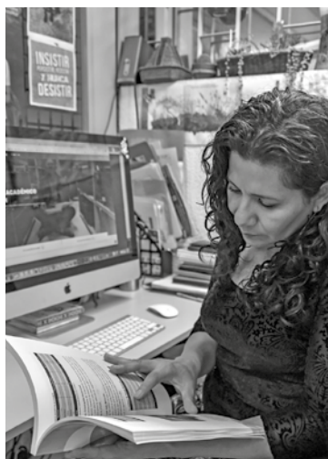
Consulta del documento.

tutores se asignaron al Programa Institucional de Tutoría (PIT), además de 429 al de Asesorías (PIA).