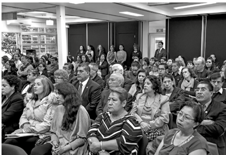
Los trabajadores y directivos, atentos al balance de gestión.