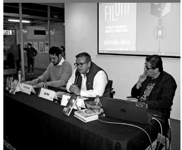
Presentación de la colección de libros.