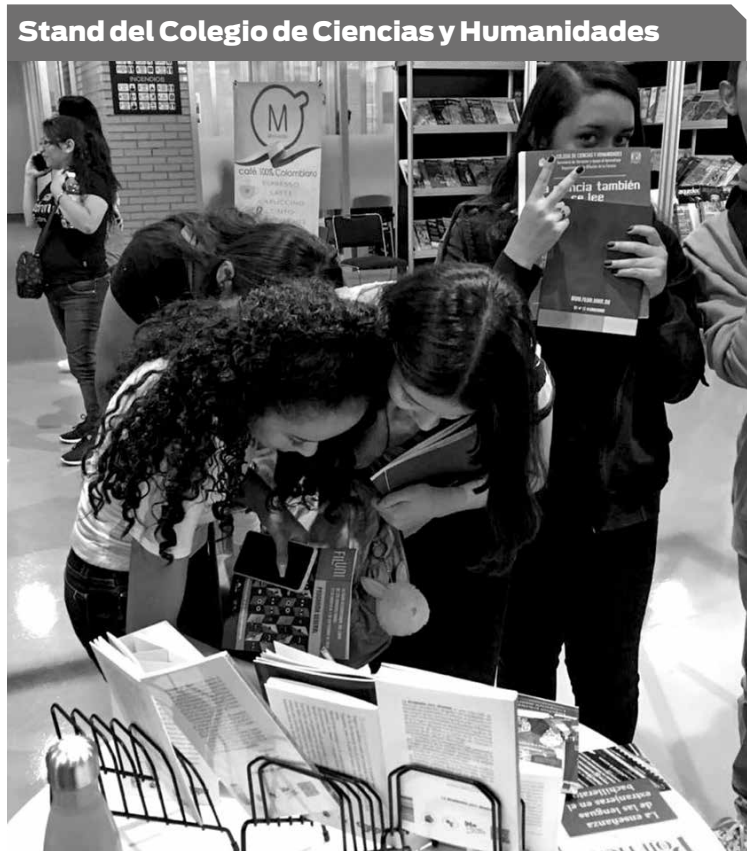
Las estudiantes se dieron tiempo para revisar las publicaciones.

6 son los títulos que al momento se pueden consultar por Internet de la colección La Academia.