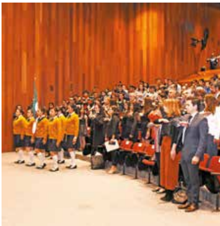
Homenaje a la Bandera en el Auditorio Alfonso Caso.