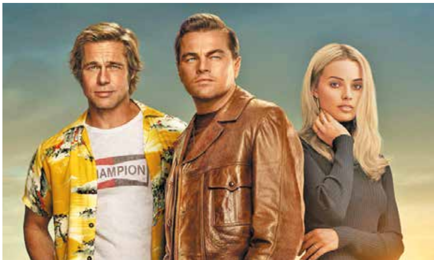
Brad Pitt, Leonardo DiCaprio y Margot Robbie.