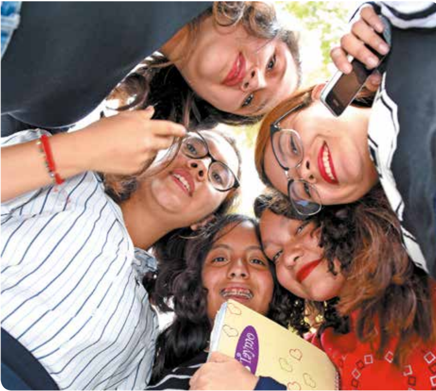
El apoyo de sus compañeras ha sido fundamental para la alumna.