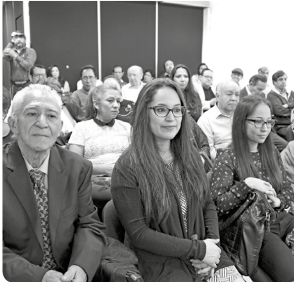
Invitados a la instalación de las cátedras.

Por lo que, dijo, con estas cátedras se rinde un homenaje a extraordinarios maestros que han dejado una huella profunda en más de un millón de jóvenes, quienes seguramente han de continuar la hazaña de los académicos que hoy festejamos. “Gracias por su labor ejemplar y tenacidad que nos inspira a continuar con el maravilloso proyecto del Colegio de Ciencias y Humanidades.”