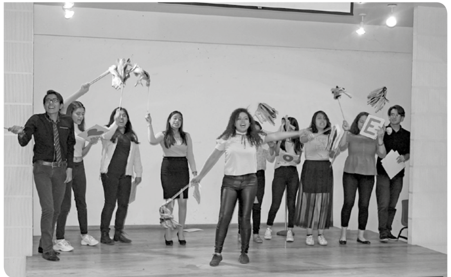
Cantaron algunos temas en inglés para demostrar lo que aprendieron.