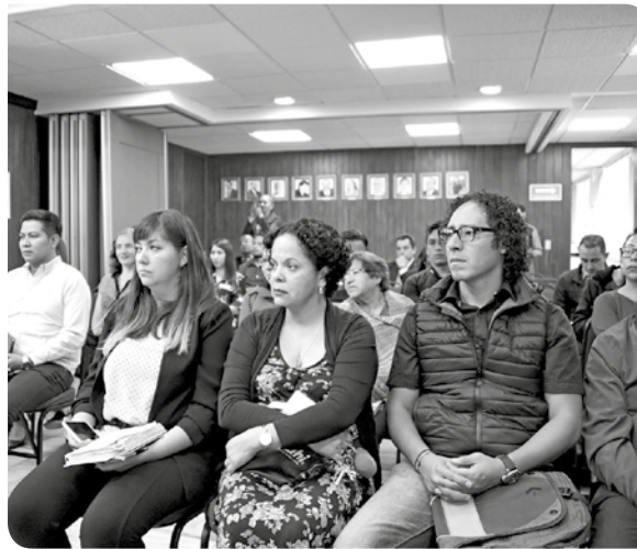
Presentación del curso en el plantel Naucalpan.

El funcionario sostuvo que la vinculación de las diferentes escuelas