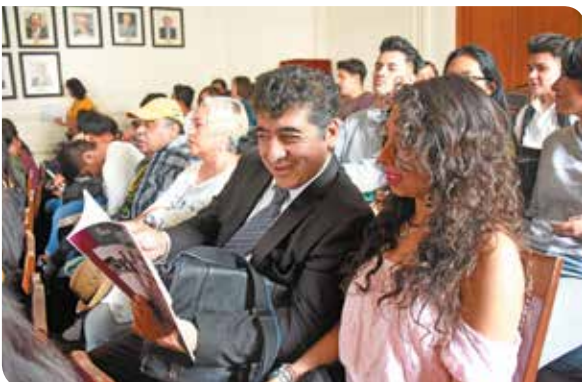
Los participantes disfrutaron de las presentaciones.