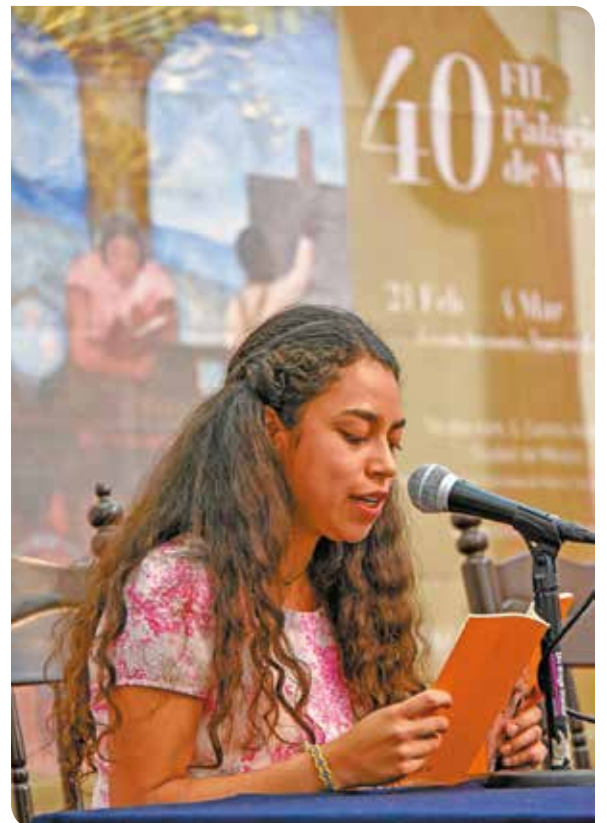
Estudiantes del CCH durante la lectura