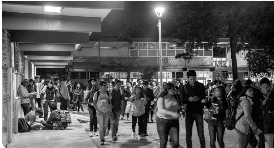
Aspecto del Plantel Azcapotzalco, en el que se ven las nuevas luminarias.

“Sólo se instalarán cámaras de vigilancia en el perímetro del plante”.