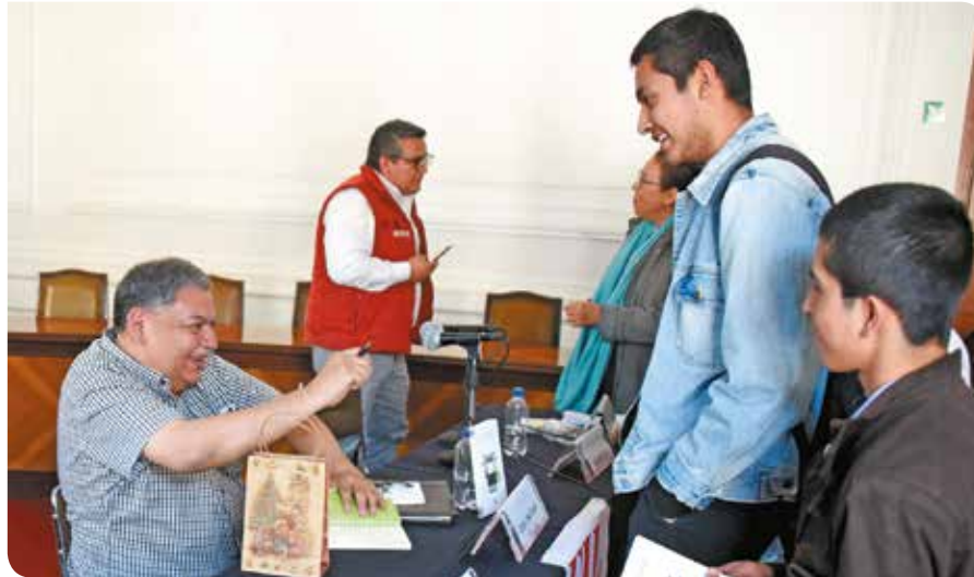
El escritor Lauro Zavala después de la lectura se dio tiempo de firmar autógrafos.

Se publicó el número 1 de Eutopía . Revista que se edita por el Colegio de Ciencias y Humanidades, donde se propone promover el conocimiento y el estudio de la enseñanza media superior. Los artículos que la conforman pretenden servir de terreno para la discusión.