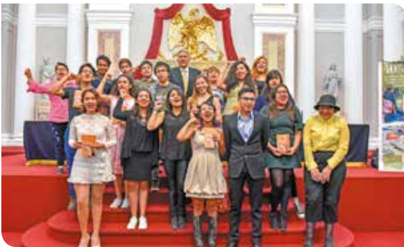
Los noveles escritores celebran con un goya.

La colección Naveluz publicada por el Plantel Naucalpan presentó el libro Litorales, Principios de Teoría Narrativa en la Feria Internacional del Libro del Palacio de Minería.