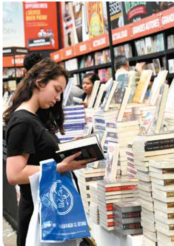
El Colegio exhibió una muestra de sus publicaciones.