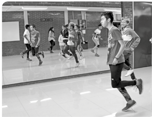
Ejercicios de relajación.

La dramaturgia ayuda a aprender a convivir y a manifestar lo que siente