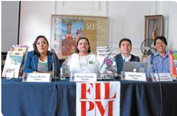
Presentación de las tres revistas del Colegio.

En esta edición de la FILPM 2019 el Colegio presentó en el Palacio de Minería las siguientes revista: Eutopía , MurmulllosFilosóficos , HistoriaAgenda , Imaginatta , Fanátika y Ritmo . Además de los libros de la colección Naveluz y la X Antología literaria de alumnos del CCH