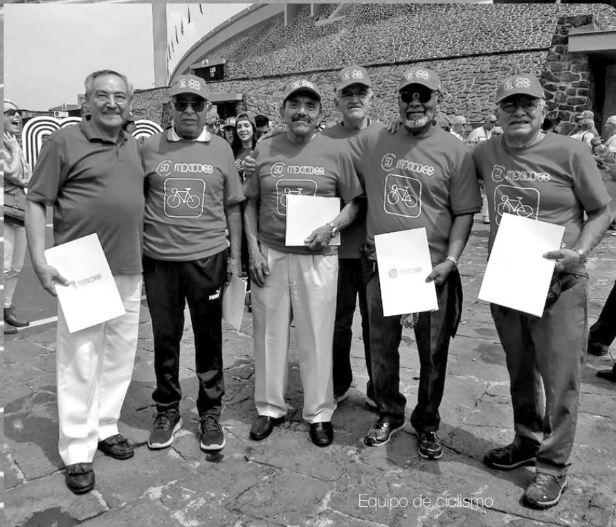
Equipo de ciclismo

La flama encendida provocó emociones. Cientos de personas se reencontraron y deportistas que no se habían visto desde entonces, aparecieron orgullosos de portar sus preseas. Lucían llenos de vida y con entusiasmo desfilaron y dieron forma a los cinco aros que representan la justa a nivel global; asimismo reconocieron a México como un país cálido y buen anfitrión. Contaron historias, anécdotas y hazañas de su participación en aquellas competencias.