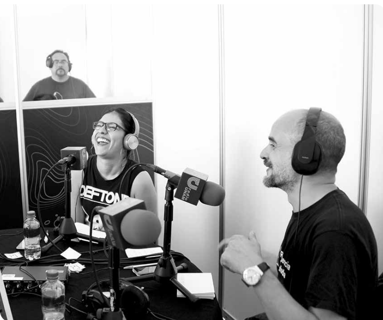
Locutores Radio UNAM

“Nos enfocamos en el aprendizaje de esta lengua y estamos conformando en el Colegio una comunidad para quienes deseen perfeccionarla”, remarcaron los estudiantes, quienes a partir de esta semana estarán en la explanada del plantel para informar e invitar a sus compañeros.